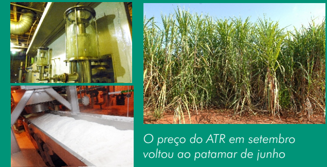
O preço do ATR em setembro voltou ao patamar de junho

A alta nos preços do açúcar branco no mercado interno e do anidro carburante puxou o preço médio do kg do ATR, que fechou setembro em R$ 0,3524, contra R$ 0,3475 em agosto.